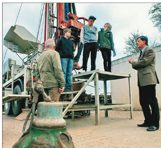
Auf dem Gelände der Familie Vormann erhielten die Schüler Informationen im Bereich Brunnenbau.

Abschließend werden Bögen verteilt, in denen jeder Schüler eintragen kann, was er an dem Aktionstag gelernt hat und inwiefern die Besichtigung geholfen hat. Die Bewertung können die Schüler für sich behalten oder mit den Lehrern im Unterricht besprechen.